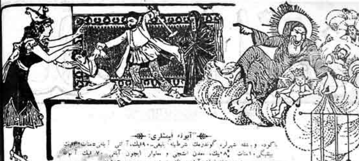
گورده. ووقه شرلره گورمکک شریطه یایی. ۹۰ لیک. آتلی یازنک صحتا یونون بیلگی. ۱۰ امانت. مدن اشچی و سبار اچون آتلی. ۲۰ لیک آتلی فیض فیدانان آتورنگ شخصی هر روزه اولمزدی عنوان: اداره و فاتورالیزاسیون چواری ابو نورده ۶۶ بولون: نومرد ۴۰۰۳ Адрес Редакции и конторы: Старо-почтовая д. № 64, tel. № 80-83.

سول طرفنده سو ایله دولی برایی سول طرفنده هیجته برایی بوخوسینده. کیرنه سلازلی. سول طرفندان گولگی دوشتا جمیتی، مور جمیتی، بی عواد نالی سوبو جمیتی، حلال احمر جمیتی نالی تاراپنی تاشختدی. اما نوزیده بوجمشتری منتر دگل اییدی. چونکه وقتی یوخ اییدی. مددرک چکنسینگ دابیلاریندا ایگی زایس قوتلاردا وار اییدی. بر نیچده کنترل اوقلی وحری نتشارلی وار اییدی.