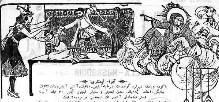
آیه اوله فیملری: و باکوه و بشفه خیرره گوریدرک شرطه ایلیه ۷۰ یلیک آلی آلی صحت مامورک یلیک ۱۰ امانت ۱۰ یک مدین اشعی و مبارک ایچون آلی ۷۰ یلیک آ آون جمعی فاجدان آتور کت نسخه هر ۳۰۰۰ فیک عنوان: اداره و انتشار امراضی یوجتوی اول نومرو ۱۶ نومرو ۴۰۸۳ Адрес Редакции и конторы: Старо-почтовая д. № 64. тел. № 40-83.

ایندی من الوالی الله آلا ایدوشور یزیم که: مقاله من اولوبلار دیمیکدر لانتکی تولی دعواسی ایبر. اما مسلمه یاده کادر، منین دیکریم بودر که: آدم کوز یوبور کنی، اما من پیغمبرینی تانین، یلین که: اولار کیمدر و حالیدر، بر نیچه وقتن باری ایران غزتلاری یازیری کرک ایران فراموشلین، یوکادا بر جولالارین حتی منین توبیکمه آقیم کابری. چونکه مسئله من اولوبدریم و پیغمبره اولاری، ایندی به قدر منی بنادان اولماشدی. آخره مدین الشین غرضی یازیر که هور کجه منی کتابلاری یوب یانبریک لازمدر، چونکه اونی امانت اولدا رساثر بر لردن تورک مسخره ایدرلره این مسخره اینکمه حقلری وارد، هله کاشک کولی سولیبوب آم آغلاما بیچم آغلامه سینه توی تبریز تودرکنت توبیزمه مسخره سینه توی یوبور که: هله تدریک اودی دوشویب، یلام آغلاما کولوم آغلاما، هله کورود دنک این سیمویب، یلام آغلاما کولوم آغلامه ایتد سیمویب، تا منیم یوبکی هوموات کتاجهارینی بشته مدرق ایچون یازیری مقاله منین خوشبیه کله کج اید، اما گوردم کله مسئله هومواتی ناله بریق سولوب اولوبور قزلیق تورک مسلمه سیدر، کویا امام حسین بر ده خلفه ایوب کیم یوبوب بقر قرین فری اولوبدر، کویا بوتکنه امام حسین فرس اولوردمش. اوکا گوردمه و حبل الشیبه دیودر که: کرک مرتیبار فرجه اولون. یوردا گورودور کیم، در بک لیکن تبریزیمه چیمک ایتدین ایران بیاباری مسئله اولجه لار قری تورکماندن بیلاشمدر، اودر که: همدین الشیبه چیخ خیاله کلمز بر قضاتی بنیلم، ایندی به قدر ایزراییل امله یارویبر که: پیغمبر لاری عریدر، اوک نوس فرس یزیرمه هولدیکی ایچون