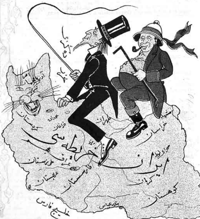
ایوان خلقك یغنی مینكوری

MOLLA - NƏSRƏDDİN ۲۰ قېت ۲۰ ئىيىتى سايىچى بىندە