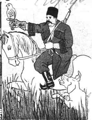
۲) آردان لایمانان سوگرا کتدی گیلترینی فیزلارینی یغوب اویناق توگرمدودیم.