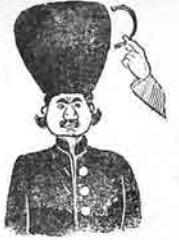
بو بورک نایه اوخورتسا یلمیریک آنجاق اون یلیریکه اوتلا بر فیلی فونانا باغینی «حشمت کتورک»

دولوم ایل ایدریدیلر، دای سن اون کورده یلمیزن... آخرک تر پیله، دیشکله ایلانز، گرک اودا اولایدن گورمیدوبن که تاسر کله فوی، یوز دودانلار، دوتواسیدو سوز بریم لاملارک برسی اوز کتورک کئی خنمادوت اولورسی کتورکده کتورک سولر، حاتاتان حاتان آدلاری مصلحتیه ایشیردین، چایوبک اوخوماغا باغینی، مچوس یله اولادان سورا بول وورلارده، حین خنمادوت بیزدیلا، هر کس توبخانیا کتورکده بوزلرک اوجینا بر شی ایشردی، دانیانلارلر که یز قندرد بول دوشدمدی، حایجادا جوخ توفرخوا، دوشدمدی، بو توما آنجای قنایانک کتورکده یوستانیبارلرک یوستانیبارلرک، ایشور توتولوب ایلان چا