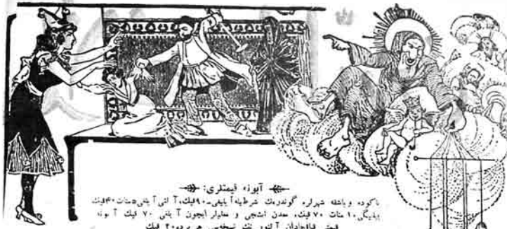
باکوه و باغه شهره گوندنک شرطیه آییله... ۱۰ سات ۷۰۰، مدن انجی و عمار ایچون آتیش ۷۰ لیک آتونه فیش قاناقدان آتورنک شخسه هر پرده ۲۰ لیک عنوان: ادارو و قاتر روزن ماکساری بوچووی او نورم ۲۶ تونون نورم ۲۰۳ ۴۰-۸۳ 64 tel. № 40-83 Адрес редакции и конторы: Баку Старо-почтовая ۴.