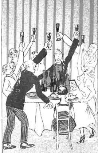
لافت و حسابنه با قیلا مشندان قاقاق