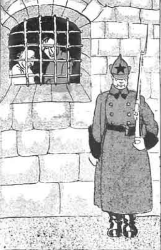
ژانفروک حسانه با قیلاندان سوگرا