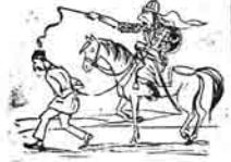
۲ - فنا احرابه لوئیه سی ایجسی مخری آت دوئنه شامه قنر ۳۸ ورست بولی یانه آرزوور