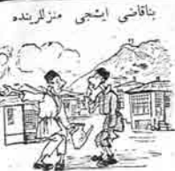
بناقاضى ايشجي منزل لرلنده