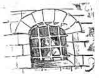
۳ - مخره اشلام حصبه سیدو بازر