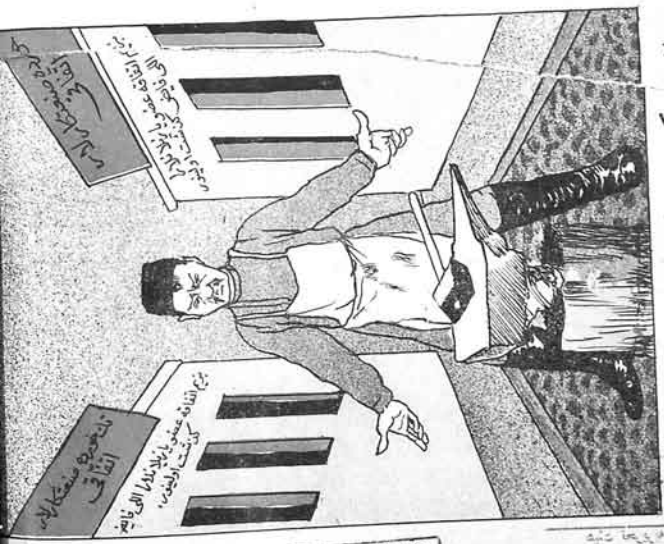
ایشی - کرده من بو ایکی افتادان عابینا یازسام باشیدر؟