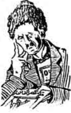
بعضی نقلی، سرقات مدیری

هنوسی کیمیردی، بزه کیمدی، هوس... اوزور دین دوتوردم، هیچ کیمدنتشیردی بزه آغریسا فوروت ادم آخلاق بر نغز دانتیشردی: لایمده شل. نفسار سفایینده اوزوروب دان بزمده اندک اولوش هوسورایشنا Фигура یاغور آخیر صوره نده کورده کیمیر که اوانان هر نه اولدا آذام لومدر من اولان چوکه کور-ایلمی ( Сопляны ) آدادوردم. هر دوما وار ایشک بهالی فاقسون (کوروس نجهک ایتم)، باغندا تارور سکه اوشتم.