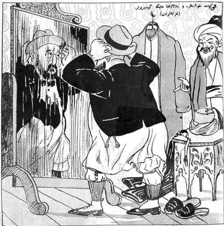
تورکونه خوابه و ملا نصرالدین کی گیسرور. (غزله اردن)

№ 44 Цена 20 коп. MOLLA - NƏSRƏDDIN ۲۰ قېك ۴۴ و بیست و نهمی ایل ۱۳۴۴