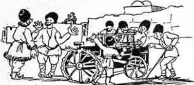
گوردمن بزم قرا مال کي بولگده تورپاغا قاشقا پيتي اولورده