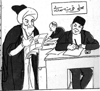
۱) مجلس قومیہ دم