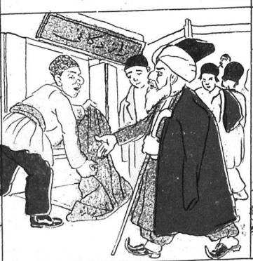
۵ - ملا آرتیق تالانچه کیری ساتوب خیردا اییدان لازملی شیلر آیر.