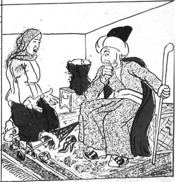
۴ - قونولبر اتیف بازارلاندان سوگرا نهوده.