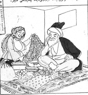
۶ - ملانگ ایکنجی بازارلاندان سوگرا نهوده.

M. S. KANAKOVA YAGH. Y. KANDAKOVA Kise № 2570