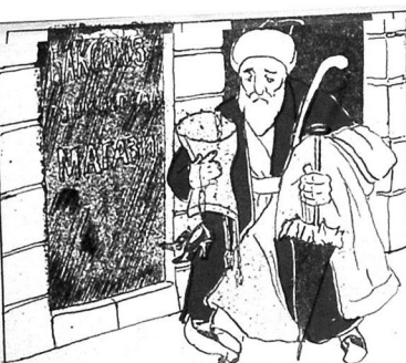
۳) - قونولبر اتیفده بازارداق، ایده یلدیگی شیلر.