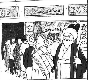
۲) قونولبر اتیفده نوب گوزلیور