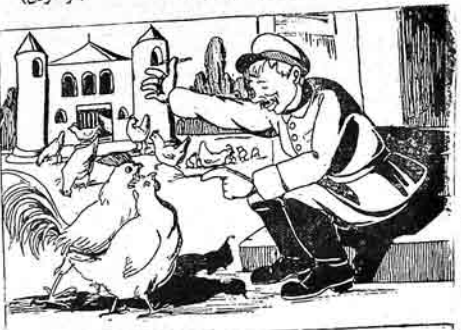
پرىتقوف - آي آلەت حق حساب يىلەمىن جىواللارى! سزە سرف ايدىرگىمىز ۱۳۰ مىتى چىقارماق ايجون ھەرگىز گونەدە ايكى دەھە بومورلاپلىگىز.

مخلى: ايراندادا جىرت اولار: بوگا ايراندادا قىمت اولار: نە يىلە، اولەندە بىر بەدەت اولار اون لكىكى آيى بوتون «زولە» دىبە كىز تولكى قاتلەنچى اولار كۆل دىبە كىز بن ايتانمام بوگا، يوز يول دىبە كىز كىلىش