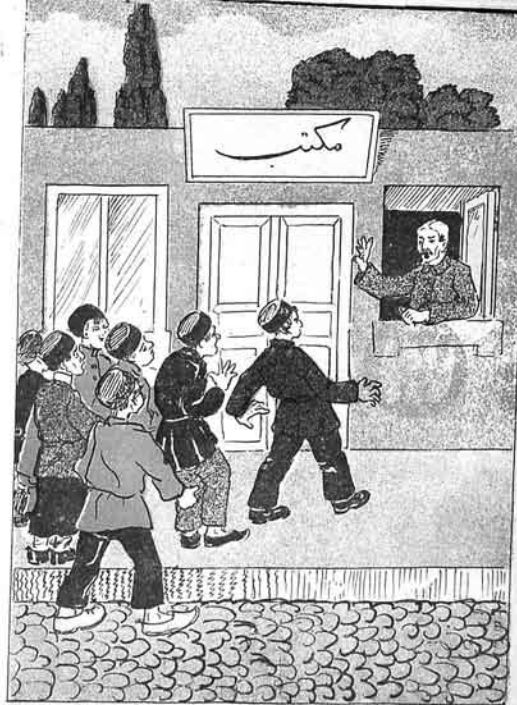
علم - درانت کتابی کوز اولماسا سنقه برانسا باجانام تعلملر - آی سلمه هر چند دقارک ه در انا دیدیکوز مکتاب علم چله انا جیقا بوبدور.