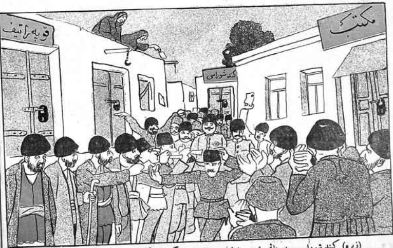
(زیره) کند شوراسی سددینک تویی اولدینی ایچون بوگون مکتب و قوپه راتیف