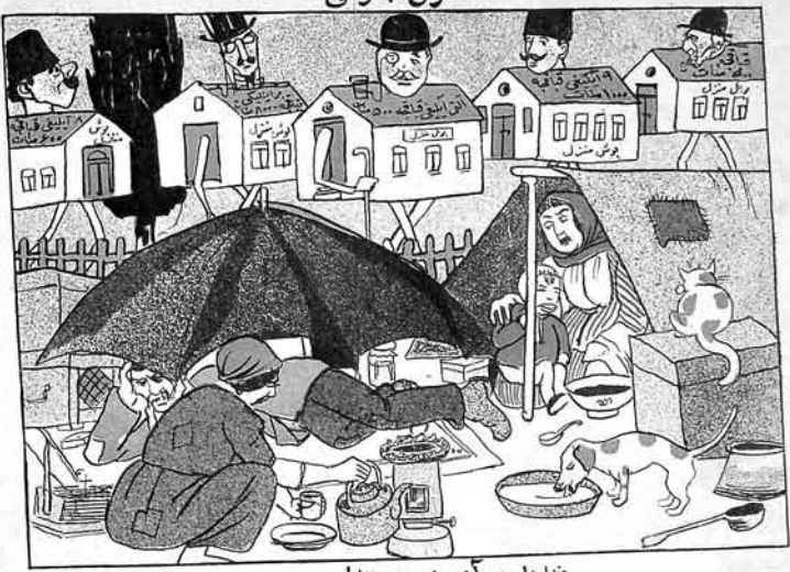
منزلزلر - آی بزه بر منزل! دهگلار - آی بزه بر ویاغلی، مشتری!