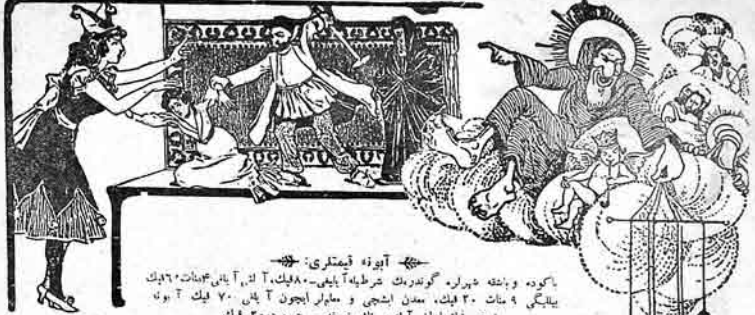
باکوده وابنه شهراره گوندرمک شرطه آباپی - ۸۰۸۰۸۰ ک، آباپی ۸۰۸۰۸۰ ک ییلگی ۹ سات ۲۰ فیک، مدن ایچی و ملبار ایچون آ با ۷۰ فیک آ بون فیتمی فیلمچادان آ تونر تک نسخه هر برده ۲۰ فیک عنوان: داوره و فالتورومز باکو ساتاری بوچنوی او نور ۱۴۳ تونون نومر ۴۰۸۳

بو تهریمی ملاصرائلینده هدیه یوب فلیتو نیلجیلار زندان، یوموش علی بن خورندان بگی، هرده خیالی، دستمالچی، کیمیزی ملحدی بو سریره جواب ویرنه چاغیرام. بولارلا طوی مجله سده آز قلمی دی سوز نیچه آدام تولون. شیر شیردن و قیصلردن بازلان طوی خیرلرینده، چویشی بو ستادده همه که، آخر وفاداره به مسلمان طولاری نه فومارسه اوتونبیرنه، لوطی لایسین و نهمه آخرا لمان ایچون کله یوب گولله بارلقه اوزرنه ییلیر. بنیم بو سوزلریمه هر کیم احتشیر ایستایسون یا نهمیران بورداد آتدیمک حاجتیم آتد ایستایسون اولر آبیاده داتر احرانیه قوبتیمکنک ستول کئیلیم، طرفینک صدرینک و مایه ملتینک ننگه عاریده بر طوی مجله سده است اولوب تونواجیه ال کتلملارنه نه آتد ایستایسون هدان طوبیلا بر نیچه قول چومایمک مست اولوب سوبی قیلرک تار کتایستیم سبتیر. معاضوب نه آتد ایستایسون هدان بولور ایستایسون ایله گنن اکی قز اوست جولارلا دیبور ییری ایله عورالیکنک لار بازلار آز لایسینی بیری ییرینی وودوب تولدور کئیلدی نهمیران، ایقان ایستایسون سنی نصیترام اللهه والیرام. امته «طوی جاهلی»