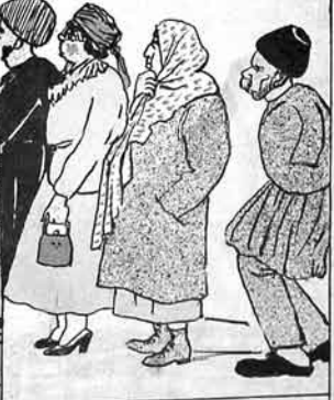
آلور وار خالوار ايه