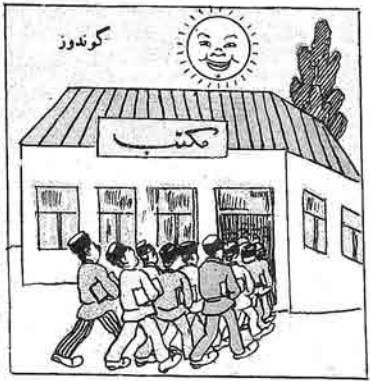
غزاق قضا سیندا یولاری کسمان شوراسدیری دوستلاری مکتبه حسی ایدیز (غزتلردن)