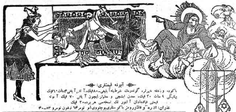
باکوه و خاتمه شہر پر گوندہ رنگ شہ طہ آ بلی۔ ۸۰ فیک، ۲۰ ان، ۲ آ پی، ۶۰ سات، ۶۰ فیک یلیگی ۹ سات ۲۰ فیک، مدنی اشپی و مامار ایچون ۷۰ فیک ۲۰ فیک ۲۰ فیک قیش و فاجادان آنور تک سخمسی هر برده ۳۰ فیک عنوان: ادره و فلاتورومز باکو سٹاری، بوجنوی او تور ۶۴ تفون نومبر ۲۰۲۳