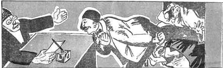
(۱) مشرول و طيله تجين اولتور.

بعضى مشرطى و طيله تجين ايدلبنگدن سوگراگنه آروادلاريني آتوب ۱۸ ياتلاريدا و شوراً حكيمته پانچي عاكهدن بر خاتم ايله كج ايشك ايشك ايشك بوران. (قومونست غزه سندن)