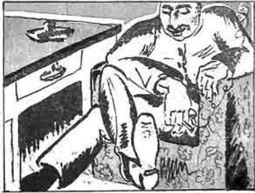
(۲) ايسه بن نوزمه لايق آرواد ناپسالي نام. (۳) نوزمه «لايق» ير آرواد ناپسالي.