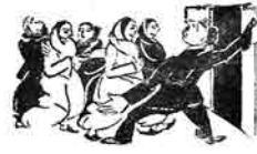
۲) كندىلارنىڭ آروادلارى قولۇ كېچىرىپ.