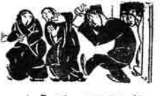
۳) قولۇيا كان ئۆز آرداى و باچىتىنى قولۇلايدۇ.