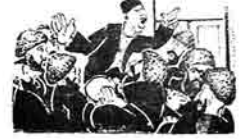
۱) کنديزى ئۆز آروادلارنى قولۇ گوندىگە چىقىرىپ.