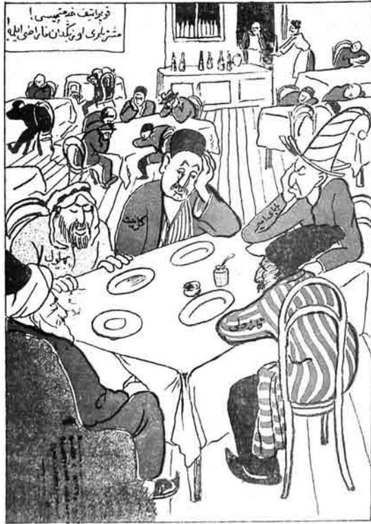
«ملاضرالدین» نازا گمش قوناقلارنا شایق ویریر. (خودک ویرنلرک مله دهی بولدر. بولگنکور. ملاک قوناقلاری مله کلتیپلوب شام پوسته اولمادانق نه سیکر.)