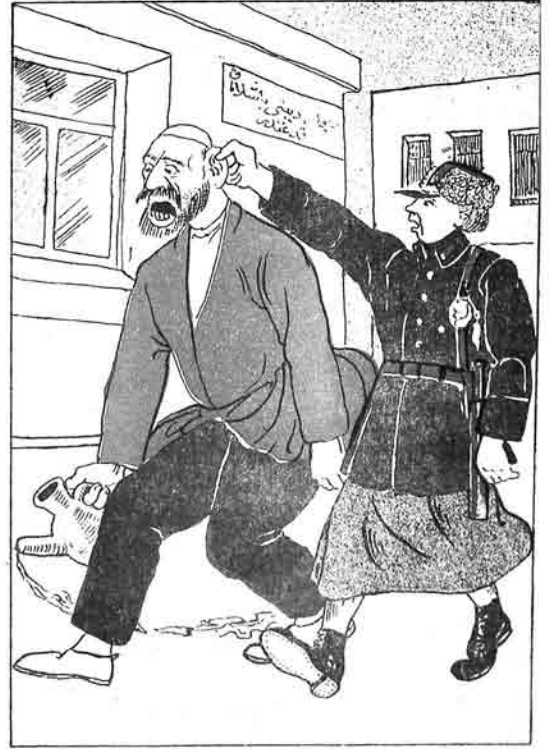
میلیس- آتواکلیما آن داتریمه گیدمک. گوربلای- بولمدهک آسری بگومور. هادیق. آرواد داندما میلیس اولار.