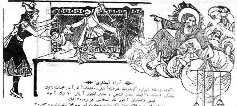
توراه آيتلري: كورده ووشته شيراز گولهدم شريفه آيتي... ۴۰۸۳