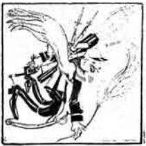
هرانه بی قورمانی (دوره و نعلک) طیاره بی سوره لیره «صلح» تکلیف