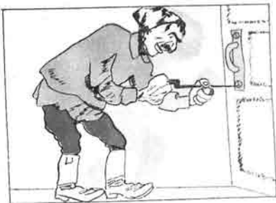
- سوگو هجویی .