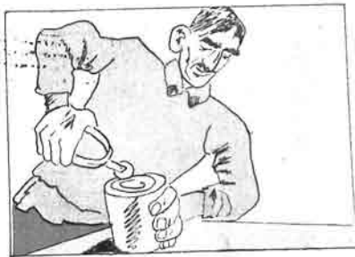
- د میر قاپ آچماق ایچون مهبیزدن یاقشی شئی بو قدر .