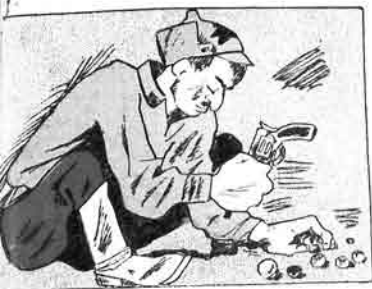
- شوغریب قوزلار دشماندان ده که نه گدر لر .