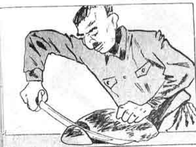
- بیجان عوضنه .