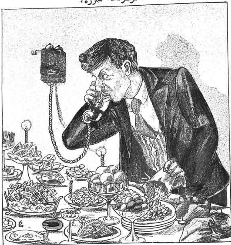
— موھوماتلە مبارزە خقندە مروت جاسرلابورام، اولسا گور. اجلاسه كه ييلمهچكم.

۱۱ ۵ ۵۲۱۱۵۲۸ ۵۱۱۱۱ ۱۱ ۵ ۵۲۱۱۵۲۸ ۵۱۱۱۱ ۱۱ ۵ ۵۲۱۱۵۲۸ ۵۱۱۱۱