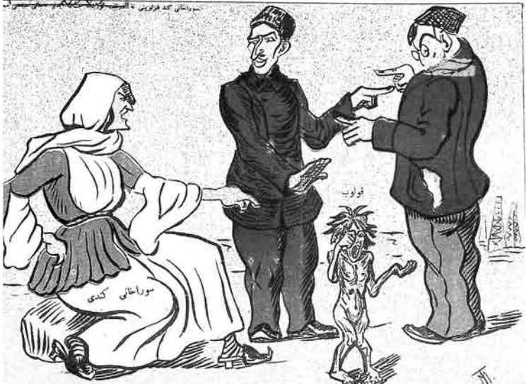
خانی کندی — آی دادتری آلیه پروادنیغ آتاسی هانکیترستور. ؟ آفرشت — بدن دگل، اونداندر. سیاسی معارف ادارسی — بدن دگل اونداندر قولوب — ا ا ا ا ا ا ا