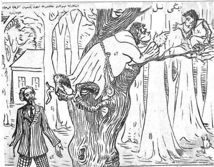
آتا — آبییم لالمش! گنل آتاشی دوش دوز بوتگی گیده. بیلمیرسن! آتا — آتاسی آعاجا جیقانگ بالاسی بوداغ — بوداغ