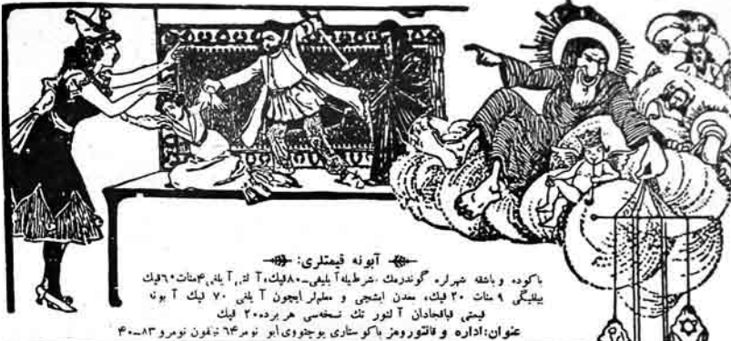
آبونه قیصرلی : باکوده وابغه هرهرا . گوندیمک خرطیله آلیلی . ۸۰ فیک . ۲۰ آ . ۱۰ یار . ۳۴ شات ۶۰ فیک بیلیگی ۹۰ شات ۲۰ فیک . سدن اینجی و سطر ایچون آ پش ۷۰ فیک آ بون فینی فایحانان آ تور تک نسخه هر برده ۲۰۰ فیک عنوان : اداره و فالتوروم باکوستاری بوجوی ابو نومبر ۲۶ شامون نومرو ۳۰۸۳

آزلمی اوفاناندان سوڅرایه بیرفلسمانه جفاقلری : ۱) دورد یوز اونوز دوقوز نقردن عبارت اولان شاعرلریزمین اوج نغری لاسون آپؤ جمعوهلریزمین چون شری پانما لالاندودت یوز اونوز آبی جوان شاعریمز عادت ایشور تتر پانما و عادت ایلدن سوڅرا ښلاسونلار فنی کتایه لاردان تورکیمه ترجمه اشمکه . ۲) "رادیه" ایچون بر مخصوص فوسبون ترتیب برهسون که بودا یلگر