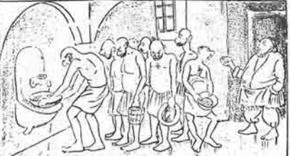
حماچی - شولوغ سالار آخری بیر قلمرده گورمه کتیکر