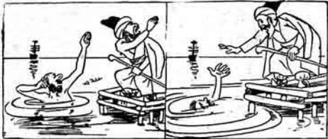
علا صحرایی - آی هاری به اسراف این وار نورانی توفیقیه استهپور ۱ - کیمین وار هاری سانه اسراف این زامیه پور سحر - سحر فعل اهرور