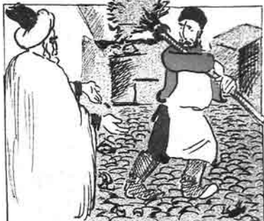
ملانصرالدین - بالام بو حیاطنی نه اچون سویرمیرسن؟ - سویرمیرم، قعات ایدوب هفته آتجاق بیرگون سویرمیرم.