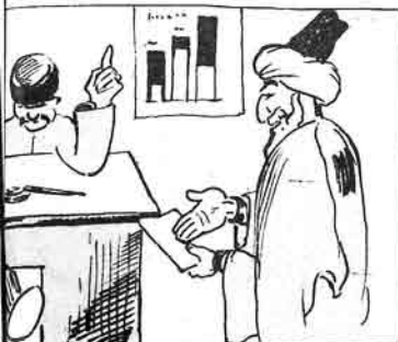
ملانصرالدین - بالام، بیر ساعت بورادا دایتمیشام، نه تیه جو - قعات دوربدر بنده سوزه قعات ایدیرم.