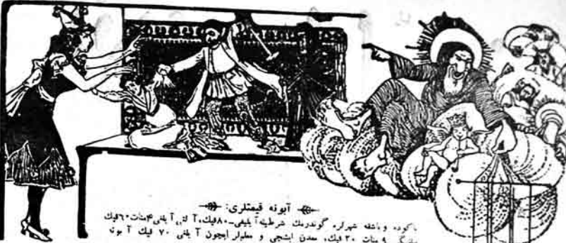
آیونه قیمتلری: - گورد و باشه شیراز گوردیک خرطیه آییسی... ۹ سات ۲۰ دیک، سدن ایستی و مللار ایچون آییسی ۷۰ دیک آتون یئگی

دینک - هر پادشاهک وقتی بر ملنک دریمگیکی سبب اولار، نیچه که ستلا عشاقلی سلطانلارنک بوچ اولمالاری