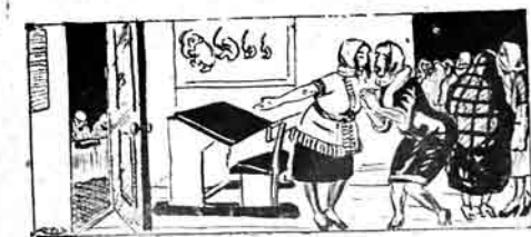
آی فیز بوینکاگی فر آی جیارت تر نه ویر، ایسیدی بن امتحان ویرچیک

سازندملر گجه گونوز جالارلار فیز گلبلر سوت اطرافک آلالار کودک اولطافه شی سالارلار ایندن آلا، آلا اله