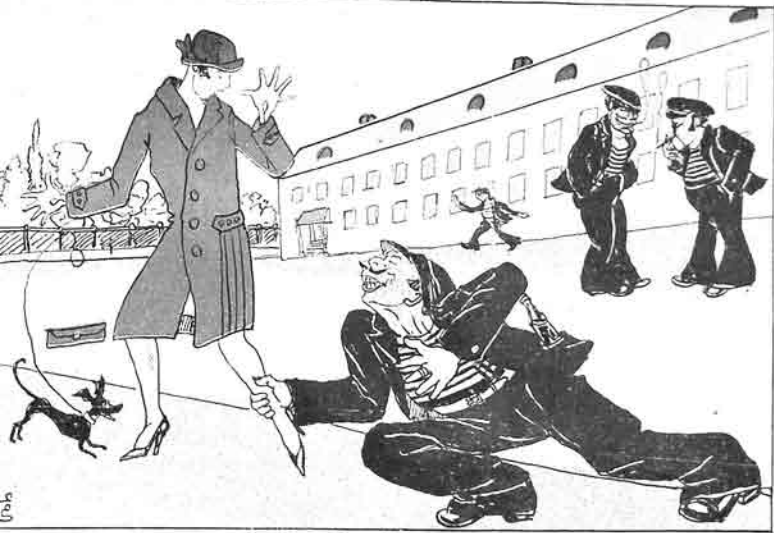
خوليقان - خانم اذن ویرنگه سزنگله تانیش اولیم.