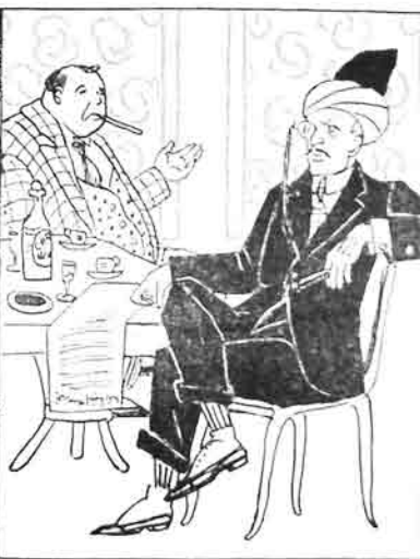
حوسس آورچير ات واعدري سيمته گوزمه ايلير.