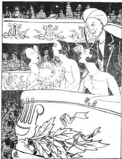
خانلارک بائدا ساققل اي اديگير.