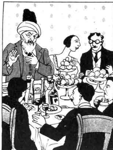
آروداسک بايراميد، به دغلي بوقدر.