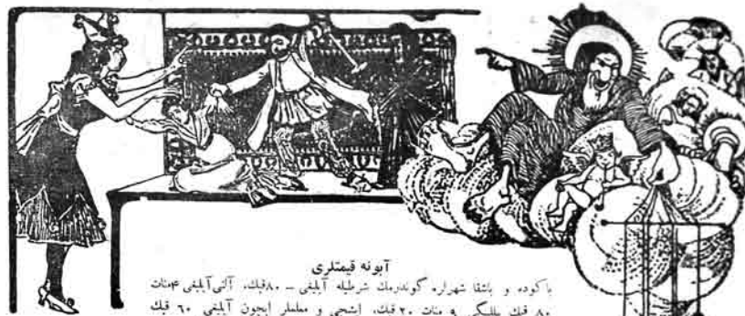
آبونه قیتمتری یا کوده و باشقا شهرله گوندرمک شرطیله آلبینی - ۸۰۰. فیک، آلتی آلبینی ۴۸۰ ۸۰۰ فیک ییلگی ۲۰۰ سات، فیک، ایشچی و ملکار ایچون آلبینی ۶۰۰ فیک Адрес: Баку, Старо-Почтовая 64, тел. № 40-83.