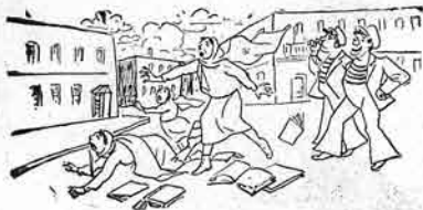
خولقالئار- هرظرافت» خولقالئق آدى قوسلار ايشمز دوزدر.

بئى كوچهلرده درس گويدوب گئڭ فئيزلارا ساتماقچىلار. (مكتوبلاردان)