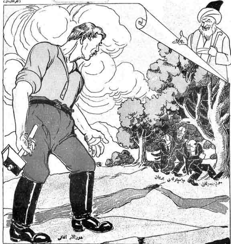
جو رالار اتقانی

بو اوج حریف دال دالا ورمکده پنن که بر قهراری و اورد.