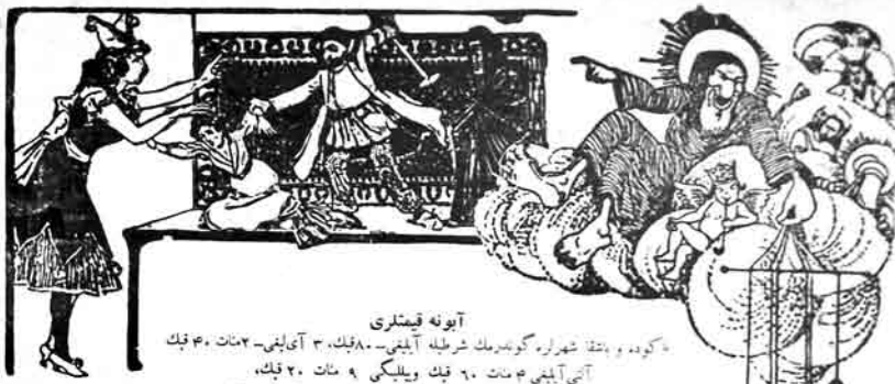
آیونه قشتری «کورد و بئقا شراره گورنمک شرطیه ایلی» - ۸۰۰ ق.ب، ۳ آییلی - ۳ سات ۴۰ ق.ب آئی آیلی ۲ سات ۶۰ ق.ب ویلیکی ۹ سات ۲۰ ق.ب Адрес: Баку, Старо-Почтовая 64, тел.№ 40-83.