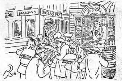
باکودا قارل مارقی باغدا غزته و ژورنال ساتان علی حسک بوه لفتک قارشیندا نسخونه کچی مشتریلر.