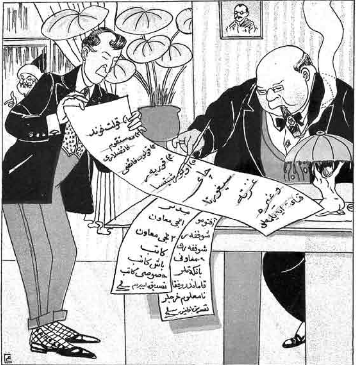
Bo'zi idare va muessese mudirlori kəuaəti ne cur baas duşurlər.

بىزى ادارە و مۇسەسە مۇدىرلىرى قنااتى نەجۇز باشا دۇشۇرلەر.