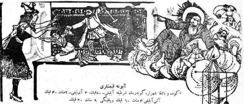
آيونه قىمتلرى ۸ كودە ۱۵۴ شەرقىي گومەرك تىرىشە آبىنى - ۸۰. ۳ آبىنى - ۷ مەنات ۳۰. ۴ آبىنى ۳ مەنات ۶۰. ۵ آبىنى ۴ مەنات ۲۰. ۶ آبىنى ۵ مەنات ۱۰. Адрес: Бакы, Сяро-Почтова 64, тел. № 40-83.

نو ياركويدنجى گونى چارسايەدار، مەلكندار و ملا- آخوندلار حاكىمىتى داشيدان، بو يوك اوقىيار اقلابنىڭ دو قوزنجى يىل دو نو مىدر! باشاسين ايشچى- كندلى و امگچيلرڭ بو يوك بايرامى!