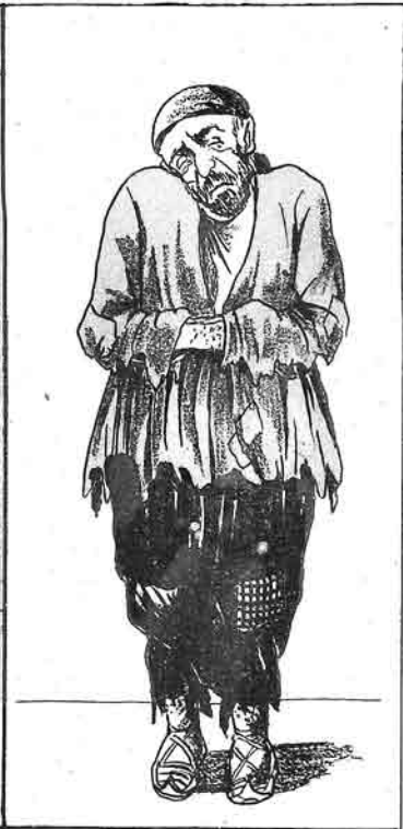
Məllijə mufəttis qədəndan sonra məscidə qədir.