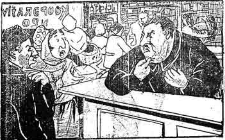
۱۴ نورمولی قوئو یه ارایق مدیری: آئی جانم سیراچینوی آخونده گیمه گیزدیگر. بر آزدا گیدوب باشقا دکانلاردا ایشکوز.

اوگون بر گرونکه بورا بن بوخودی ائلاق ایچون شامخی کویچینده اولان اوندوت نورمولی بدکانه گنجیم یله آتاون اویتی آقچینا بن بوخوده منتری اولار گوزلمکن لایتک گلمیه. دوغرودان ایله قوئو ارایق دکانی مدیری ده تنگ گلمشیه. آخری جاره مدی بوزنی مشرله. دونوب دینکده. آئی جانم داهای شهرد دکان بوخودی سیمیزی لاپ جانا گیزدیگر جان کویک بر آزدا باشقا کاندان آکک. یازاردا دکانچیلار آغزی گونیه یزیرلار. عقیقا مدیرک حتی واریدی. ایله اودا تنگ گلمشیه. منده تنگ گلمشیه. آخونده بوخود ائلمش قوئوب گینیم. مجرد