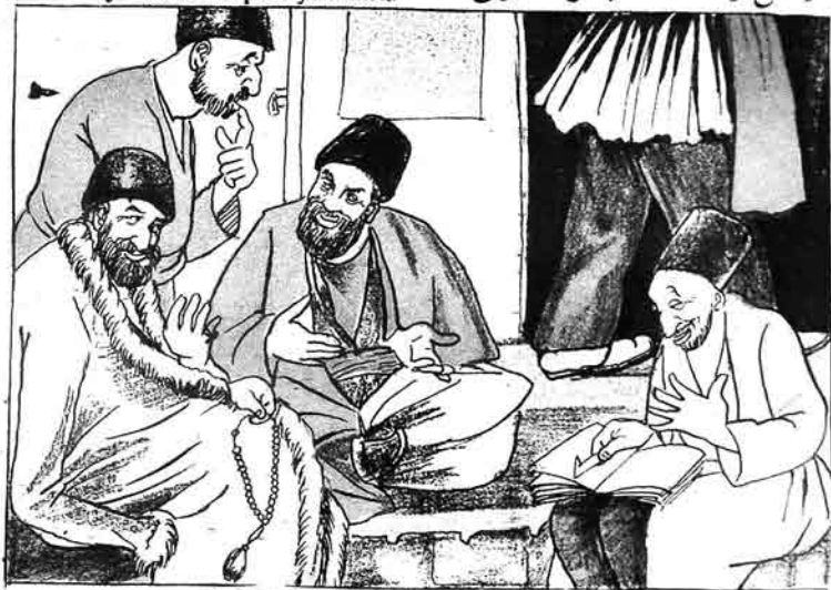
بری اوخویورد- درسه گیدن براوشاق-چیمدی یوز اوست قوجاق اویریلمی- باه باه آده یونلار دنیای دوتاجانلار گورد نلر بازرلار.