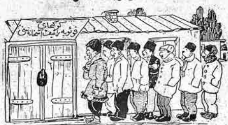
ايشيلر كوزيلورلر كسمت ۱۱ ده مابر قايى آچسین اولاردا چاي ايجوب ايت كيشيلر