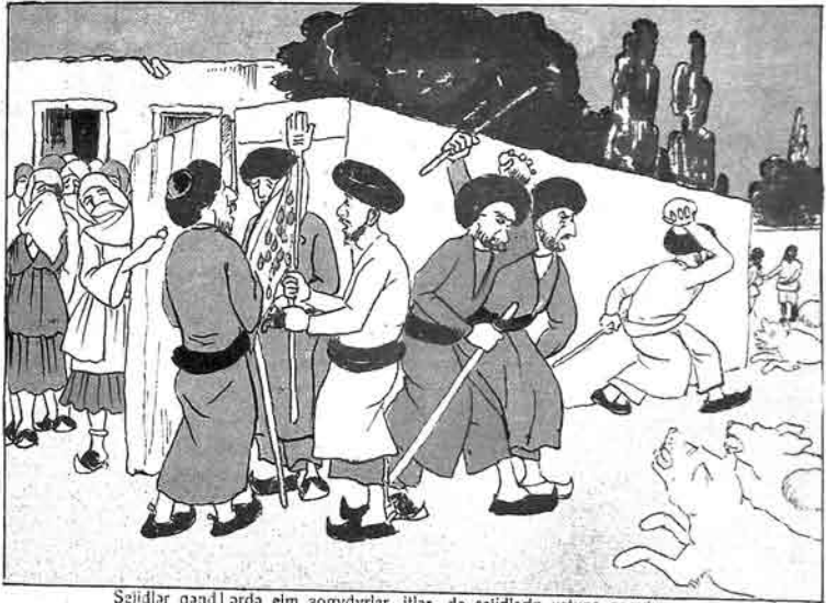
Sejidlər qəndlərdə elm əogydyrlar, illər də sejidərlərin ustuna əogyjyr.

سەیدلەر دە علم شەغودورلار ایلرە ایلرە سەیدلرک اوست شوغوبور.