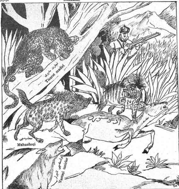
Jaxrı jaglı tiğə ələ düşmədi, nə fəidəçi avçı boğazımızda kojdı.