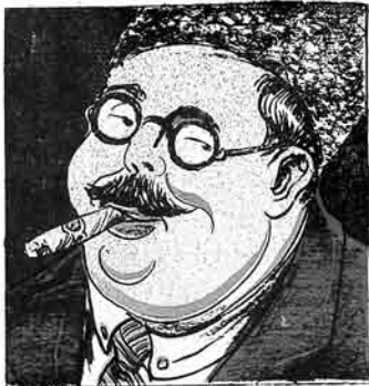
پاسوق زاوودی مدیری: بو ییل کتدلیلر زاوودا پاسوق کتیردیکده اونلاری بر هندهن آرتق قایردا سالامایاجاغما سوز ویریریم.