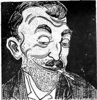
فوتوبراتیف مدیری: ایشیلره فرهدیت مال ویریلدیکده سوز ویردیم که بیرده مال گیزلتمهچگم.