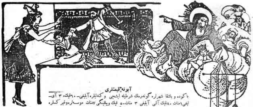
آبونه فيستلري باكوده و باشقا شهرلر گوندرمك ترنپله ايشي و گنديلره آيليني . ۹۰۰مليک ۳ آی- ليني مات ۸۰۰مليک آني آيليني ۳ مات ۵۰۰ قنک ويليکي مات دوسلر و غير گنلره اسكي قيت ايلهده

Адрес: Баку, Старо-Почтовая 64, тел. № 40-83.