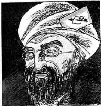
سجدرده ملالارمن: یزده سوز ویریریک که بوندان سوکرا داها ایستور آشکاره ایستور گیزلین نه کینین که جگنیک نه ده صیبه اولویاجاغز.