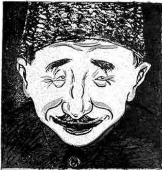
فضالرده یاردیم ناساسی مدیری: سوز ویریریم که بوندان سوکرا هرکه (یعنی هرکندلیه) فرهدیتی دوژگون ویریریم.