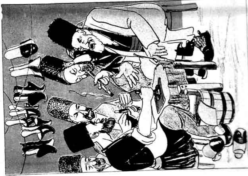
اورومندھا کرلاکھن پکی گھنسر کرلاکھن، گورنمنٹکے پوٹرو سپرورڈن صحت اہلکار، عربیہلادھا - عربیہلادھا جنی اسپتالیاں گاتولاجیلار قورداقاری دوقری نووہلادھاں سبھت اداکار