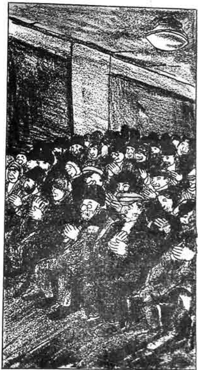
Kooperatif uzvləri isə umymi iclasda kooperatif idarəsi və təftis komisjony üçün əi çalырлар قوتوبەراتیف نەزەرى اىسە عومى اىجلاسدا قوتوبەراتیف ادارەسى و تفتيش قومىسيونى اىچون اىل چاليرلار.