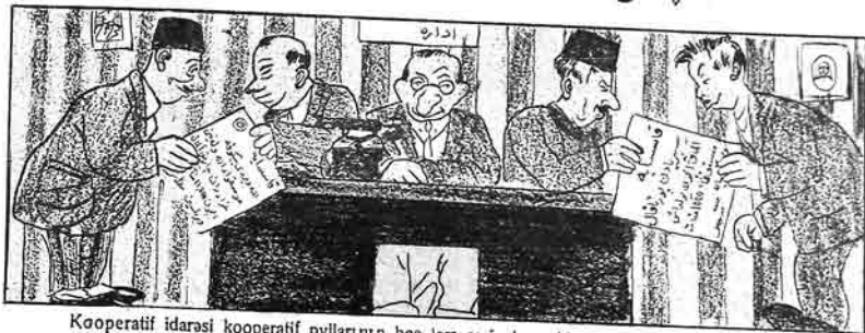
Kooperatif idarəsi kooperatif pyllarının bos jərə sarı olynmaka «çalınmasına» bais olыр. قوتوبەراتیف ادارەسی قوتوبەراتیف پولاتارنىڭ بولارنىڭ بوش یرە سرف اولونماقچە چالینماستىنا باعث اولور.