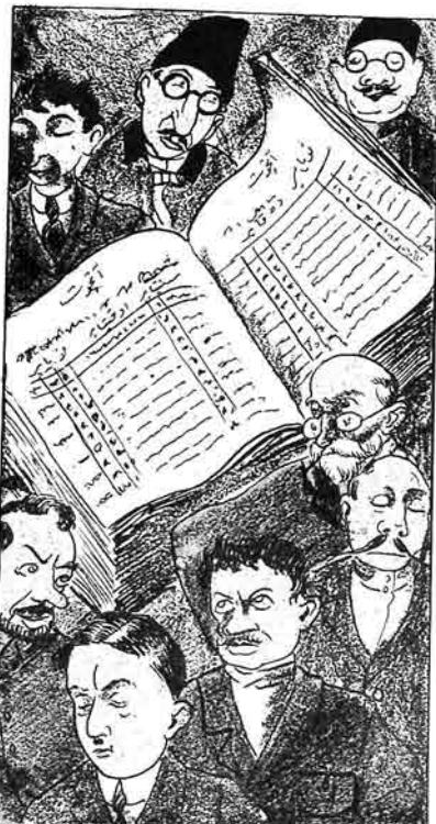
Təftis komisjony by zaman qipriqlərini çalыр. تفتيش قومىسيونى بوزمان كىپرلىرىنى چالير.