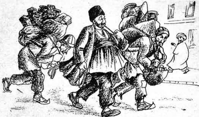
— اوشاقلار ایچون بر جزئی خم خورد آکیشام!