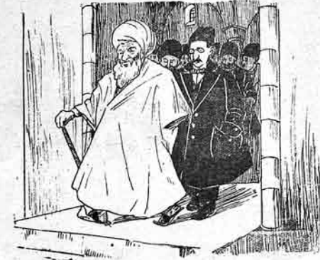
تشریک مەلماردنە اوروج دوتوب مسجده کیدیلر واردر

(اور نوموردا اولوق) بالابا ایتیزه، بالاسینا.