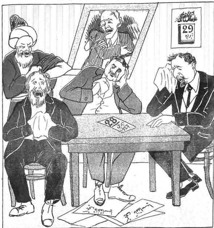
خارجله 28 آپریل گوندا