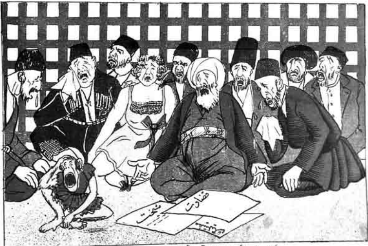
کهنه خور- نوکوتبارده 28 آپریل گونده.