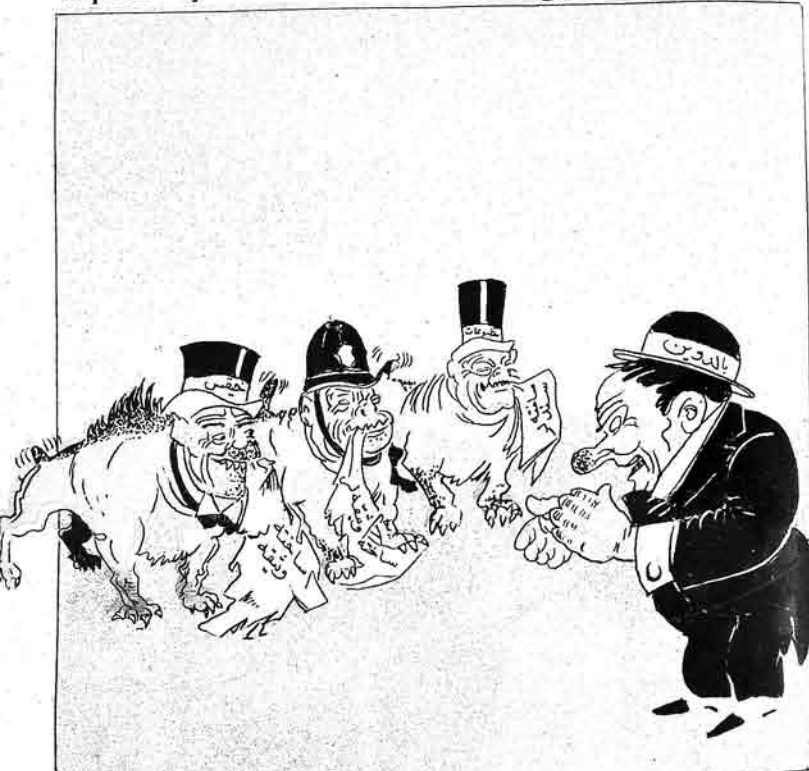
İllər jənə zənciri kırılsalardı.