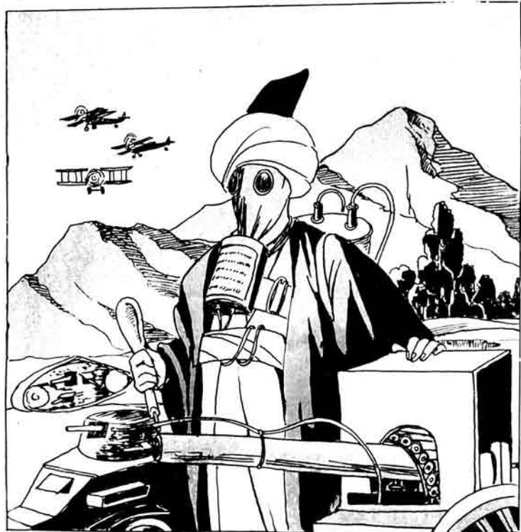
Molla Nəsrəddin həmişə hazırdır! ملا نصرالدین همیشه حاضرند!

...ملا نصرالدین، ملا، برتیا جوان، سید، دوزخ، غنیم ...ساز، دوزخ، وکی، نو، سینه، و اولماناتید.