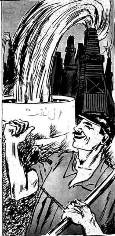
ئورا، ئقتی لاتانئە، سائتە سئە لاتانئە، ەلبە باسەرماتق اولماز. 3yrə nəfəli fantanئە، saxta sənəd fantanئە، ەلبە باسەرماتق اولماز.