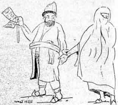
۱۳۱۱ هـ. ش

ملاص: آخوندمه سالتی ایچون بوخری س یزایرام گنک گله‌جکده لازم اولدی: برسی بود که رشورده سائده اسباقوم اولار منم اعراقی هج علم ایلمیوسه یله هلموک اوزلیدی کرک اوزیم سن تانا ایلی سن بریتره ایله ک لوی داه حیدت بورالماسولار، یزایدیم کدیجیلر. آخی اودر که ییر ایکی خند بونان فلق، خولک کشندن اولور نغش لر شه منجه اولان مرحوم ییر معنی آفانک اوشلی جوقاندا منجولر گلوب آفانک وطنی اولان خور کورلر اولدی. بیچن یارا کیمک اعراقی بودک بلاجه، آرواده قوره کیشی آتیشی یز آخیم آفانک گوزوت کدیجیلر. اون کون آفانک کیمه قلمی اشی اوشی اوستندر که لک اوشی یارا ایلی جولنا طریقه نجف اشرفه مورته زین ایله نیچوره گمشتی منجولر و افتراننده خاشی شیخ کریمک اوزار ایله محکم قوناق ایچنلر سوکر آغا وقت یولا دوستوب گیمی، اوزده ۳۷ من متیاره آبردی هاسی کی کدیجیلر آغه بخش انشیلیم. ۳۳ جیمیور که ملاص لر ایلم زورلیم ۲۹ جی نورستمد هج طهر اولمک سولجلی مقابله علاوه اولراق کولر ایچیم که آفانکی بوجان امیر اولان کیم ادهنی خلق محکمی آغز ایلی سوکرا امیر اوف یا کوره گیمور جموریت برلق بورونه شکست یهمن سوکرا، ایش یا کورایست نیشدر دور آغلی اوف امیر اوفی چاقوب دیردی که باشی اوشلی شکایت یازن ایله مندلر آلاباشین گل کیمک شیخ امیر اول بون راضی اولانیشدر. مهلتی. ایرانی یی بولا سالیق نف منزلیمده میرزا رشا کرمالی یسلیه منقل اولوب نغدمه قراره گنک که ایرانا اولان برشی وایرا، اوست رشوت و سوتوجیلیق. واقه یی یزایلیبمک، ییزمده