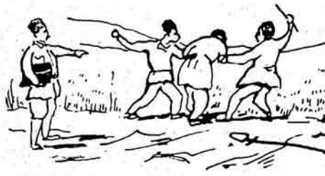
- آده وورلك بوسايللى سوي چيغين!