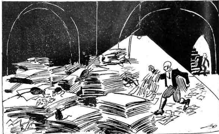
ترك سلاح مستلشی بقتده کی فرادلار آخرده سیپانلارا قست اولور.