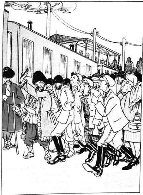
ماشىن يولا دوشىدىگە كۆرە، سىزنىڭلار باغاز قاسىرىنى كېڭىيى قالغا باۋاز باغاز اېلە. يەتتە وىرىمگە آيدىرلار.