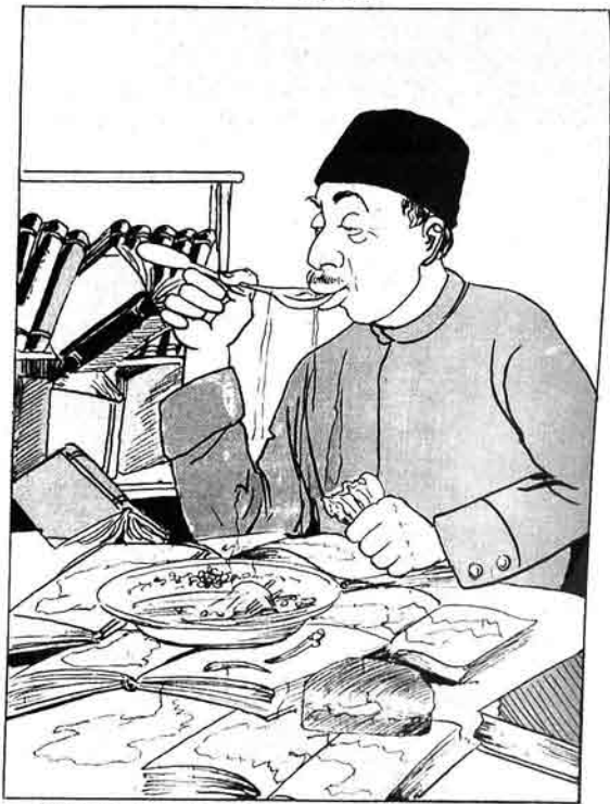
كىتاب خەتتە بىر ايلان شىمالاردان بىرى بۇدركە: كىتابتە خورمىك بىك اولماز. بىن سىزە اولماندا تاۋت خورمىك بىلەن.