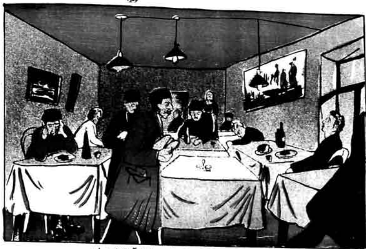
شیری - باختری ودر که نهارک مایلدینی باشنا آشپزخانهده ایلم.

۱۳۸۱ لریمز یمک خانه ویش بیکن سوئز ایکینجی ای قهر کج دوروزک، مطوق نکه کوب استولان آرق جوردی و شرف بیکنس فراترف دوروب یمک خانه نولر.