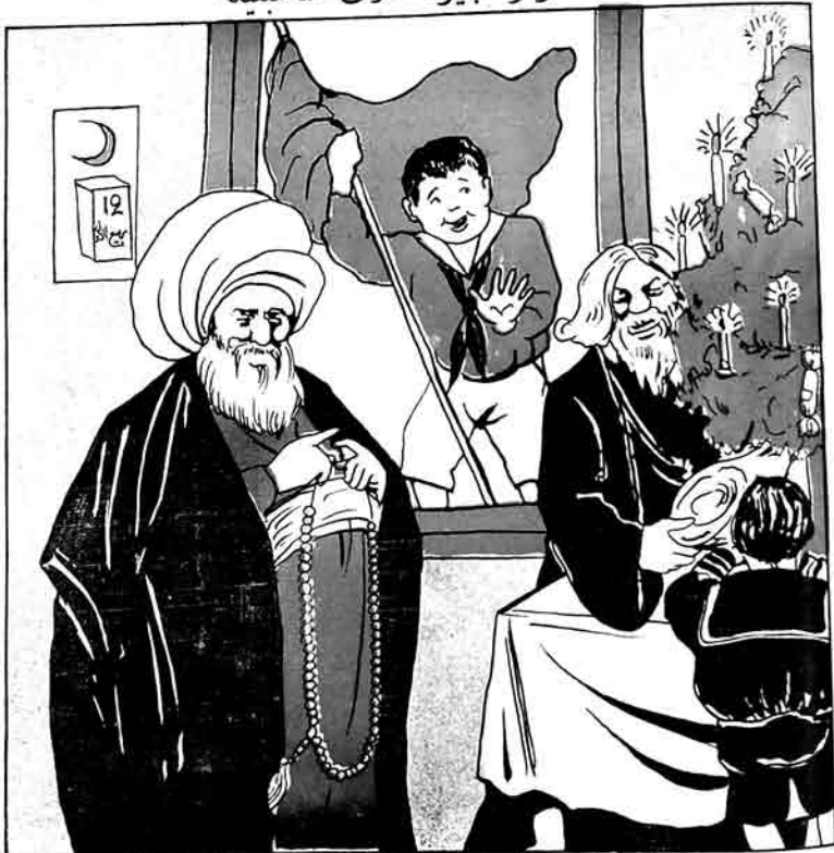
قىرمىزى بايراقلى - موھومى بايراملارىگىزى نەقدىر طنەئەلى اېدىرىگىزى اېدىك: آخىردە ھامىگىزى بو تارىخى

قىرمىزى بايراقلى ۱۹۲۸ - ۱۹۲۹ - ۱۹۳۰ - ۱۹۳۱ - ۱۹۳۲ - ۱۹۳۳ - ۱۹۳۴ - ۱۹۳۵ - ۱۹۳۶ - ۱۹۳۷ - ۱۹۳۸ - ۱۹۳۹ - ۱۹۴۰ - ۱۹۴۱ - ۱۹۴۲ - ۱۹۴۳ - ۱۹۴۴ - ۱۹۴۵ - ۱۹۴۶ - ۱۹۴۷ - ۱۹۴۸ - ۱۹۴۹ - ۱۹۵۰ - ۱۹۵۱ - ۱۹۵۲ - ۱۹۵۳ - ۱۹۵۴ - ۱۹۵۵ - ۱۹۵۶ - ۱۹۵۷ - ۱۹۵۸ - ۱۹۵۹ - ۱۹۶۰ - ۱۹۶۱ - ۱۹۶۲ - ۱۹۶۳ - ۱۹۶۴ - ۱۹۶۵ - ۱۹۶۶ - ۱۹۶۷ - ۱۹۶۸ - ۱۹۶۹ - ۱۹۷۰ - ۱۹۷۱ - ۱۹۷۲ - ۱۹۷۳ - ۱۹۷۴ - ۱۹۷۵ - ۱۹۷۶ - ۱۹۷۷ - ۱۹۷۸ - ۱۹۷۹ - ۱۹۸۰ - ۱۹۸۱ - ۱۹۸۲ - ۱۹۸۳ - ۱۹۸۴ - ۱۹۸۵ - ۱۹۸۶ - ۱۹۸۷ - ۱۹۸۸ - ۱۹۸۹ - ۱۹۹۰ - ۱۹۹۱ - ۱۹۹۲ - ۱۹۹۳ - ۱۹۹۴ - ۱۹۹۵ - ۱۹۹۶ - ۱۹۹۷ - ۱۹۹۸ - ۱۹۹۹ - ۲۰۰۰ - ۲۰۰۱ - ۲۰۰۲ - ۲۰۰۳ - ۲۰۰۴ - ۲۰۰۵ - ۲۰۰۶ - ۲۰۰۷ - ۲۰۰۸ - ۲۰۰۹ - ۲۰۱۰ - ۲۰۱۱ - ۲۰۱۲ - ۲۰۱۳ - ۲۰۱۴ - ۲۰۱۵ - ۲۰۱۶ - ۲۰۱۷ - ۲۰۱۸ - ۲۰۱۹ - ۲۰۲۰ - ۲۰۲۱ - ۲۰۲۲ - ۲۰۲۳ - ۲۰۲۴ - ۲۰۲۵ - ۲۰۲۶ - ۲۰۲۷ - ۲۰۲۸ - ۲۰۲۹ - ۲۰۳۰