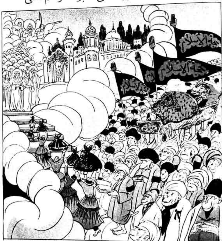
آلاکرو بدخلون فی الجان - فی آی آء ریکما نکذبان.