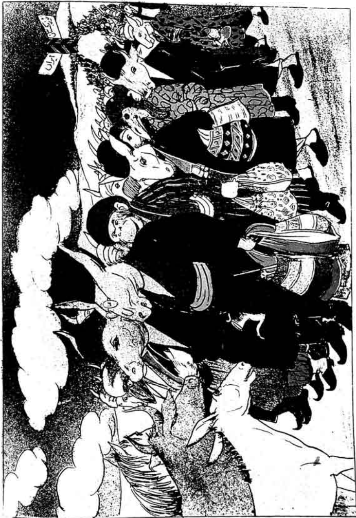
شواللار - احويللاردا خلق ايديريك بريم نورانك اولاريس ايجومودو - - - - - سورود اولاريسلر.