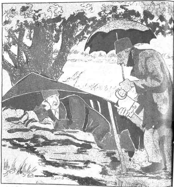
«فرا تامل» دىن

۱ - «چون بورادا كاشوسن، ايلديريمه نى فورقورمان؟ ۲ - «ايلديريم» من شغلى تقيدىن فورقوب كيزايشم»