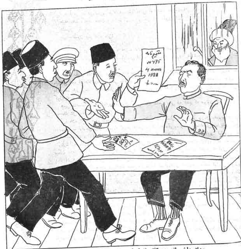
سوادسىزلىغى لغو جمعيتك خدمتچىلىرى - بالام بو قدر آدمام بىللوب باكويه تەك كلبىكز؟ قضارلردن گلن ايشچىلار - سىز بو نىسم ايله يىزى نوزفانسا چايفراماشكزىمى؟