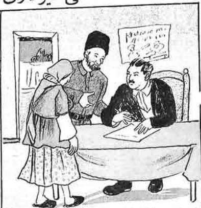
کندلی قیزی - (فنا معارف شیمسی ایدیمی نه) - بولداتش سن آلام شی کوندا کیدوب پاکوده اوخویوب قورتاروب کلوب کندیزده خدمت ایدیم.