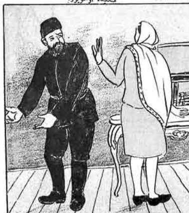
کندلی - قیزیم بو یورد کیده کندیزه قیزلاریمز ملامسز فالوبدر. قیز - بوقه بوقه من کده کیده ییلمیم.