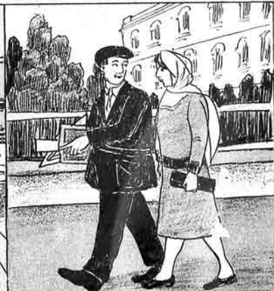
مکتبی قورتاروب نوزنه شهرده ایش آتاریز.