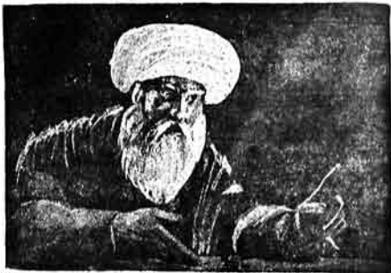
روحانى - ير الله بندلرى سن نه اريك هر بيرده داييميز گوده كدر. هر حالدا هوراده بيرده بير مسجد كلسا، شوراسى اولمالور.