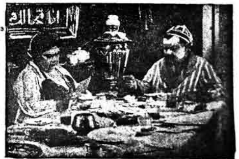
مخبره سي بييم قونولوس فرا قاندين شورايه سه جور ناينده گيلوبور!