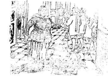
Misa zala - nə kədar multə İtəro biletli qəllərə həmsəl, oxymylara vətir, qə məndə oxymyə oltardım mənəda varıjlar.

Har çənd məscidimizin ja- rətında olan bəjuq bir məqbat balaca bir binədə jərələub çək çəntiləqlər çəqlirsə əmmə jənədə jalınız „namys“ xatirəsinə biz bəkjyə jyvəsə, lən məscidimiz- dən ə qəturmərid, imdi səz Ə- qı muxbirlərinizdir.... baədə „QOR oqlı“ olmaq üzrə... çəpyr jətər.