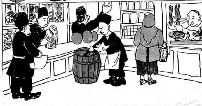
2) bir aıdan qena öz jerlarına kəbyl olynırlar.