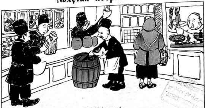
1) kilylykdan çıxurlar