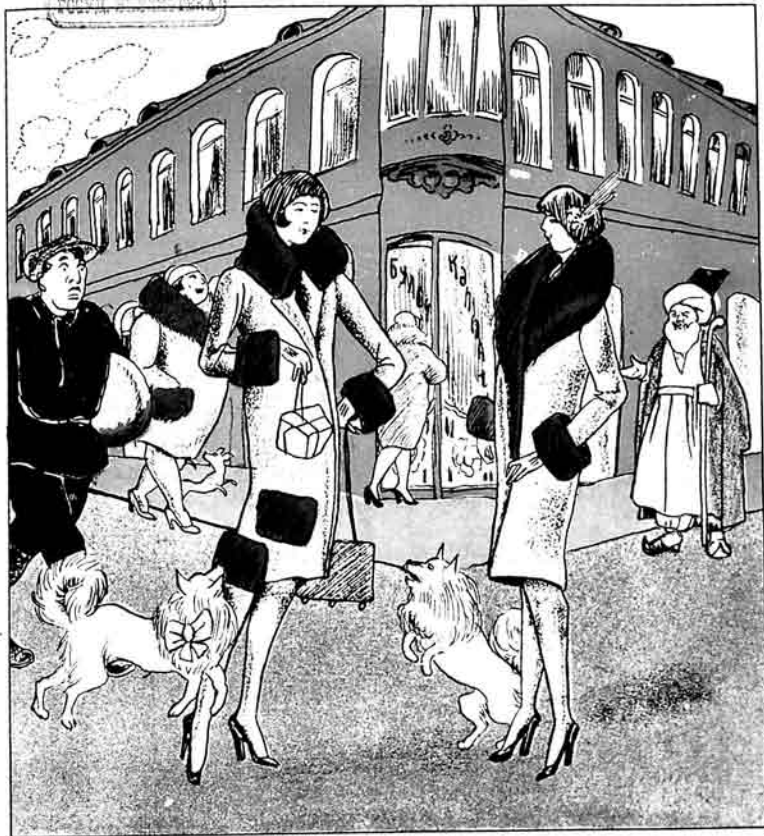
Ticarət komissarı, hejvanlara çorəq jedirtməqə razı olmyr, onyüncynda man öz itimə bylka verirəm.