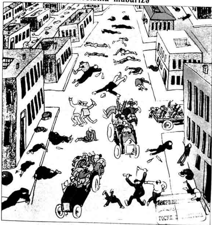
Иҗәи дуҗанлары. 15 қун бағлы олыб Мажн оньнда аҗландан сонра 3 қун муҗ дотинда (11-12-13) 270 нәтәр сәрхозьклядан зәһәрланьныс ва җараланьнысlara тә'җиһ җар- дим җәстәрлимиҗдир.