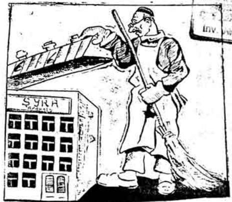
„Dvornik“ Bəh-bəh! Syra apparatında qarış sursmalı canlar vıarsə!